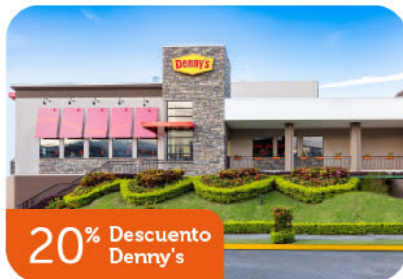
20% Descuento Denny's